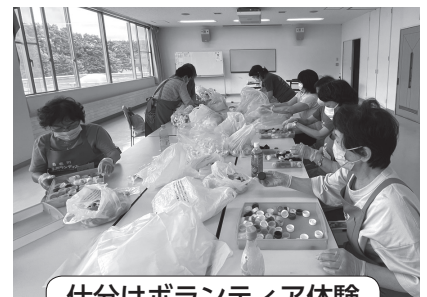
仕分けボランティア体験