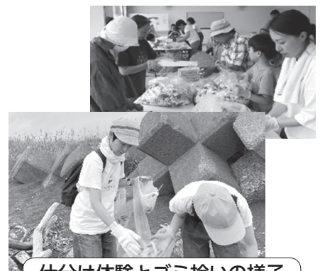
仕分け体験とゴミ拾いの様子

8月3日(木)に、海岸でのごみ拾いとミニチュアフードづくり、流木アートの作成、ペットボトルキャップの仕分けを行いました。今回は、「さんぽ」とくいと「ミニチュアフードづくり」とくいを引き出しました。参加者の方からは、「海岸が少しでも綺麗になってよかった」「可愛い作品が出来て嬉しかった」という声が上がりました。