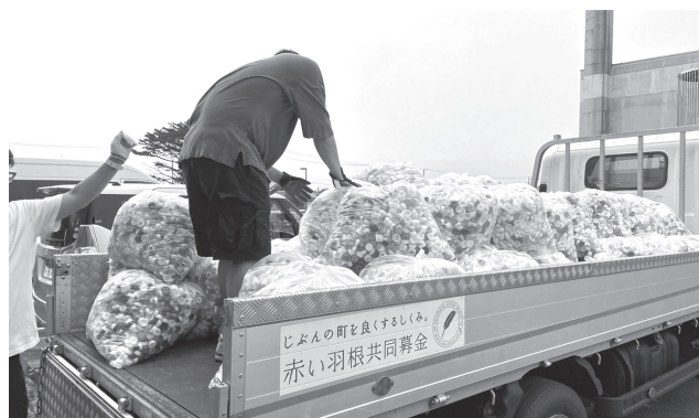
▲積み込まれたペットボトルキャップ

8月22日(火)にボランティアさんの協力のもと、ペットボトルキャップを搬送しました。今回は648kg搬送することができました。ペットボトルキャップを集めてくれる皆さん、仕分けボランティアの皆さん、搬送ボランティアの皆さん、ご協力ありがとうございました。“仕分けボランティアをやってみたい”“積み込みならできるかも…”という方は下記お問合せ先までご連絡ください。皆さんのご参加をお待ちしています。