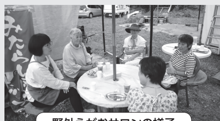
野外えがおサロンの様子